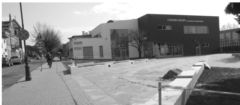
Kto dziś pamięta, że ten plac był drugi raz budowany, gdyż...?

Jednak jest granica takiego trzymania ludu za gębę. Z kadencji na kadencję w dorosłe życie wchodzi nowe pokolenie, którym już nie zatka się buzi skateparkiem i ścieżką rowerową. Będą wracać z Zachodu ludzie, którzy „łyknęli” normalnej demokracji i normalnie funkcjonujących urzędów i państwa, i będą domagać się swojego miejsca w życiu publicznym. Takie procesy zachodzą niezauważalnie, ale zmieniają rzeczywistość czasami w niezwykły sposób.