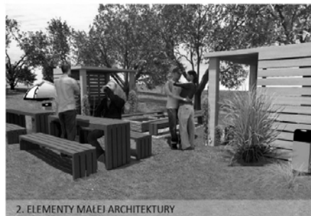
2. ELEMENTY MAŁEJ ARCHITEKTURY