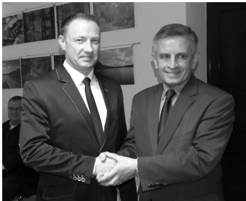
Były starosta gratuluje obecnemu.

- To dzięki najbliższej rodzinie mogę stać tutaj w nowej roli. Decyzja przyjęcia propozycji nie była łatwa, lecz wsparcie ze strony rodziny pozwoliło mi tę decyzję podjąć.