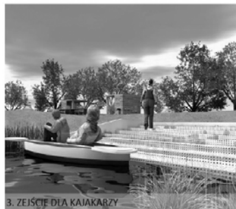
3. ZEJSĆ DLA KAJAKARZY

(ŁOBEZ). 21 listopada gmina Łobez złożyła wniosek w konkursie grantowym „Tu mieszkam tu zmieniam” organizowanym przez Fundację Banku Zachodniego WBK we współpracy z Bankiem Zachodnim WBK S.A.