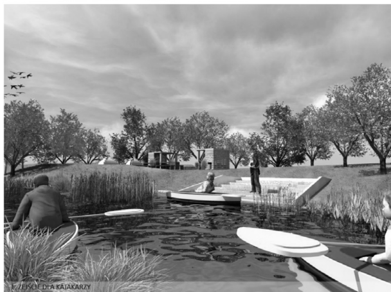
1. ZEJSĆ DLA KAJAKARZY

Konkurs grantowy organizowany przez Fundację Banku Zachodniego WBK we współpracy z Bankiem Zachodnim WBK S.A.