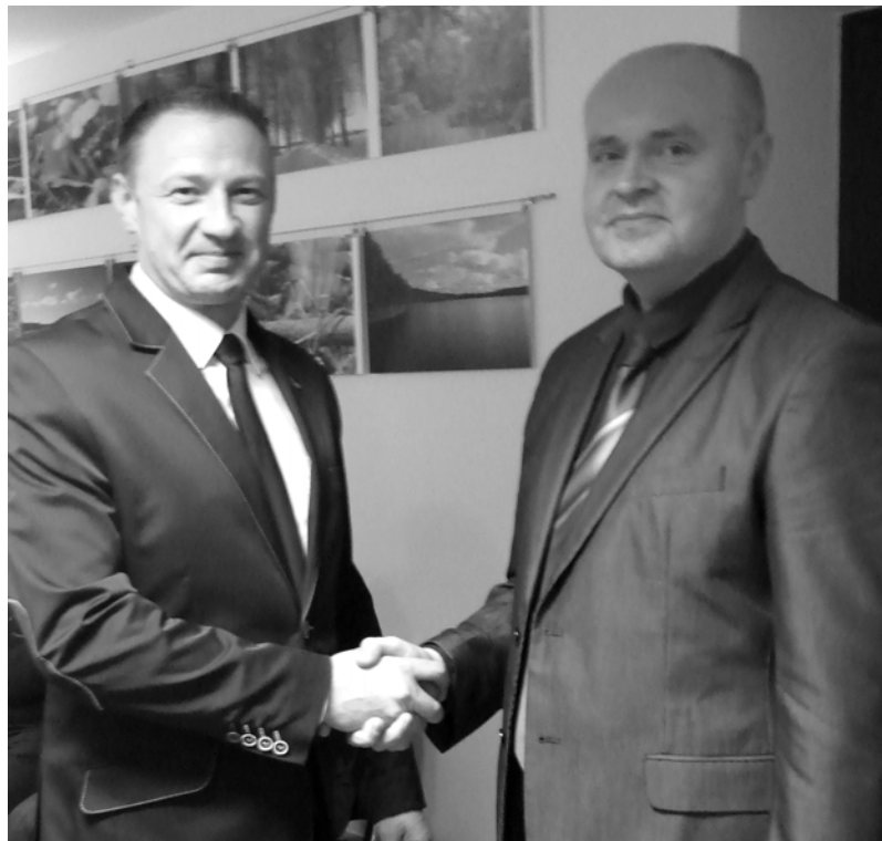
Nowy starosta i nowy burmistrz Łobza chcą współpracować