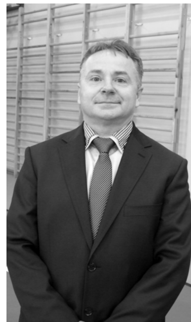
nia br. w urzędzie gminy. Więcej informacji w BIP i urzędzie gminy w Radowie Małym. KAR

W związku z tymi decyzjami wójt ogłosił konkursy na oba stanowiska. Pierwszy konkurs dotyczy obsadzenia stanowiska sekretarza gminy, drugi – podinspektora do spraw obsługi organów gminy, zdrowia, kultury i oświaty. Oferty w obu konkursach można składać do 19 grud-