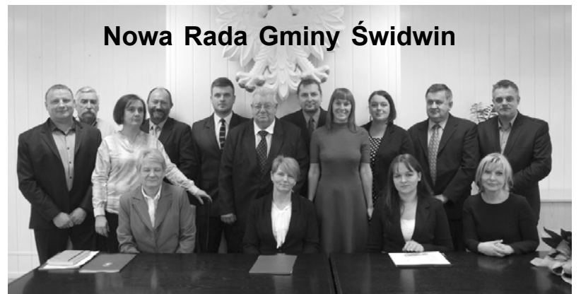
Nowa Rada Gminy Świdwin