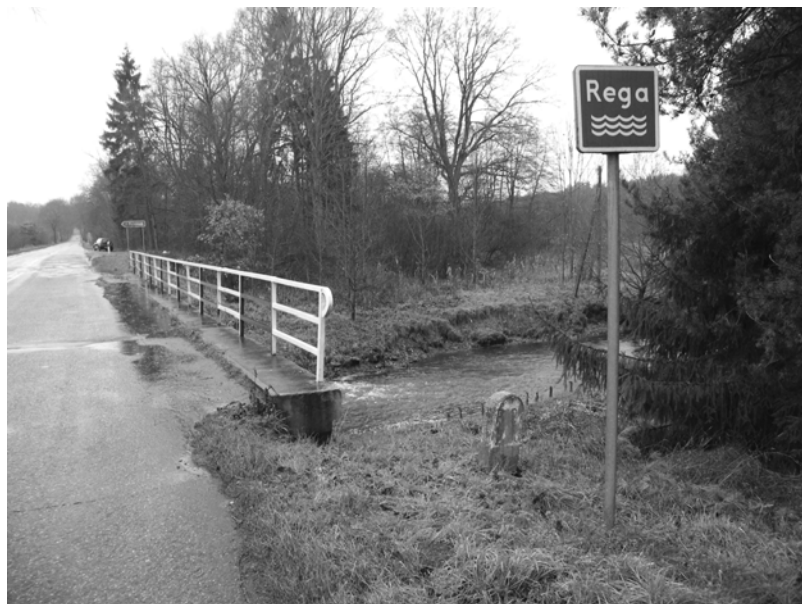
U góry: Droga na Łobez, biskup Karol Wojtyła ze studentami biwakował nad rzeką na łące przed mostkiem, gdzie dzisiaj rośnie las. Na dole: widok na mostek na Redze jadąc od Łobza do Świdwina; po lewej stronie na opisywanej łące dzisiaj rośnie spory las.