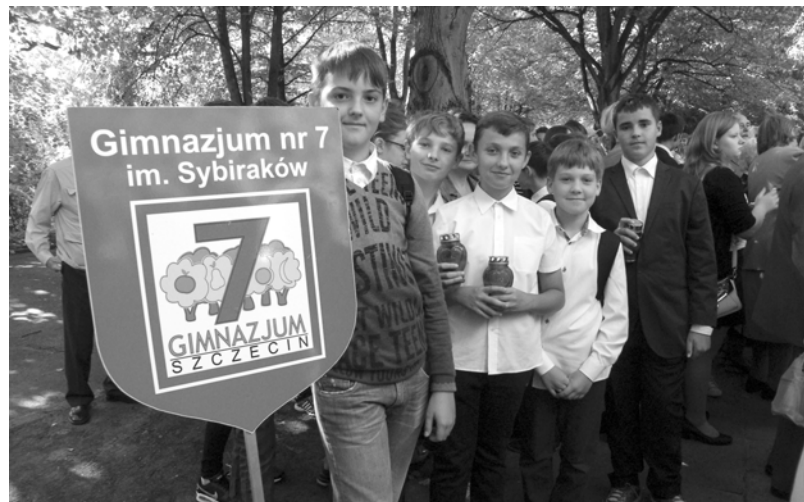
Na uroczystość przybyli uczniowie z Gimnazjum nr 7 im. Sybiraków w Szczecinie, dumnie prezentując szyld swojej szkoły.