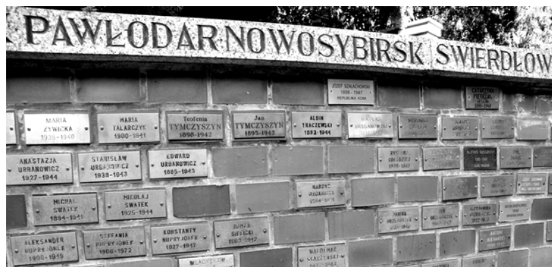
Moją uwagę przykuł mur z mosiężnymi tabliczkami, z nazwiskami Polaków, którzy zginęli w Katyniu lub syberyjskich łagrach.