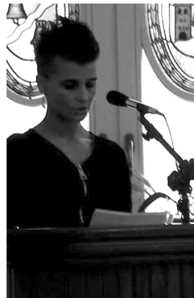
Pracownica DPS odczytuje protest