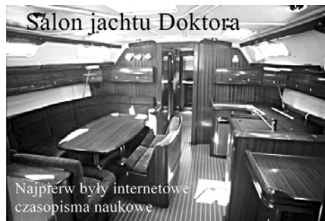
Salon jachtu Doktora

Najpierw były internetowe czasopisma naukowe