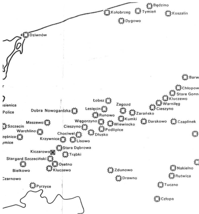
Mapa niemieckich obozów pracy na obecnym Pomorzu Zachodnim