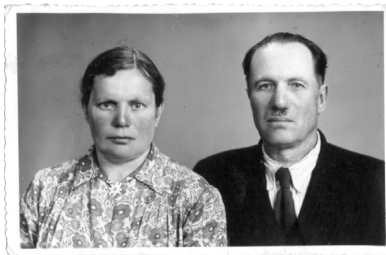
Legionista piłsudczyk, obrońca kraju 1939 roku, sybirak, andersowiec, z Zagozdu Str. 7